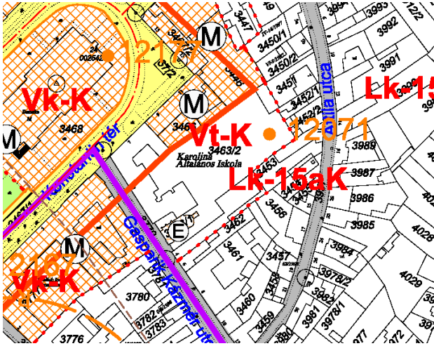
ALAPRAJZ GROUND-PLAN - GRUNDRIß

a helyi védelem alatt álló építészeti értékek nyilvántartására